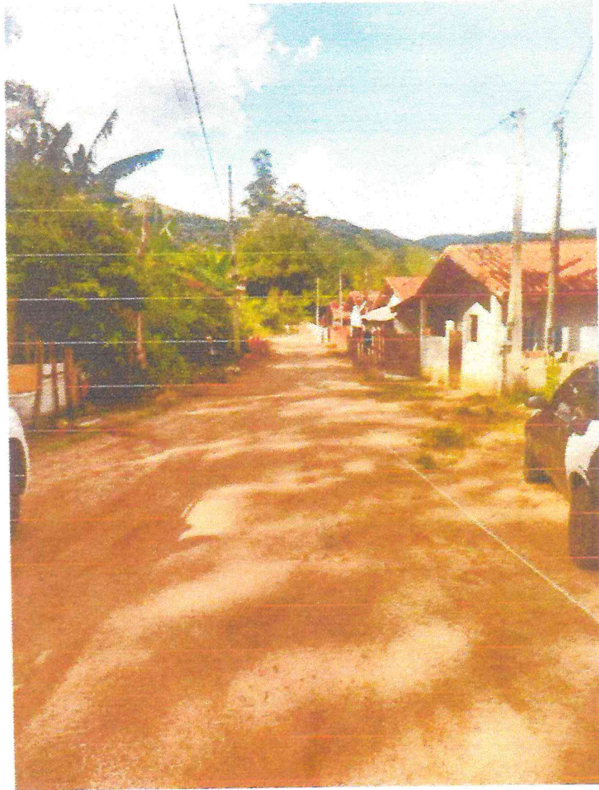
Tipo da imagem: Foto da Rua/Avenida Descrição da foto: Rua dos Lagos