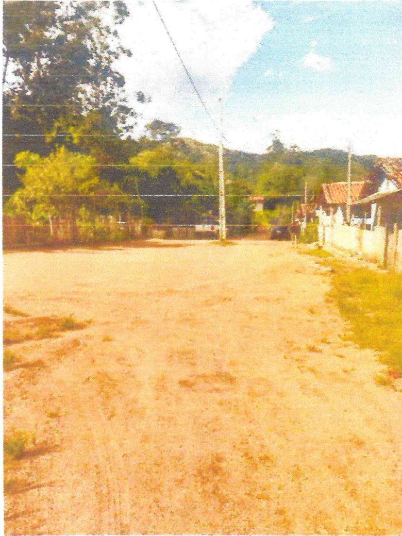
Tipo da imagem: Foto da Rua/Avenida Descrição da foto: Rua dos Lagos