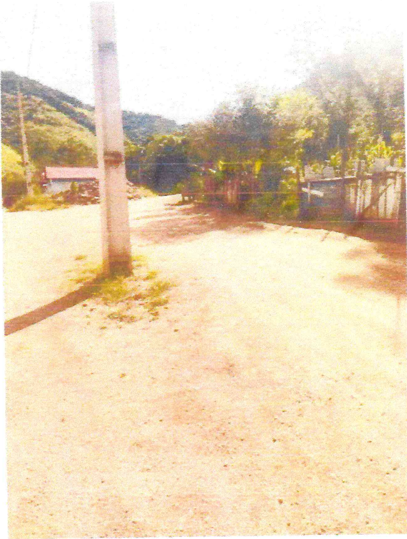
Tipo da imagem: Foto da Rua/Avenida Descrição da foto: Rua dos Lagos