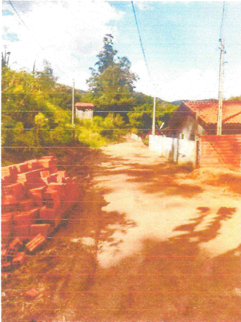
Tipo da imagem: Foto da Rua/Avenida Descrição da foto: Rua dos Lagos