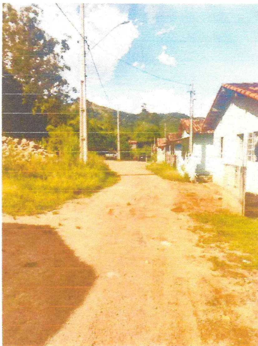
Tipo da imagem: Foto da Rua/Avenida Descrição da foto: Rua dos Lagos