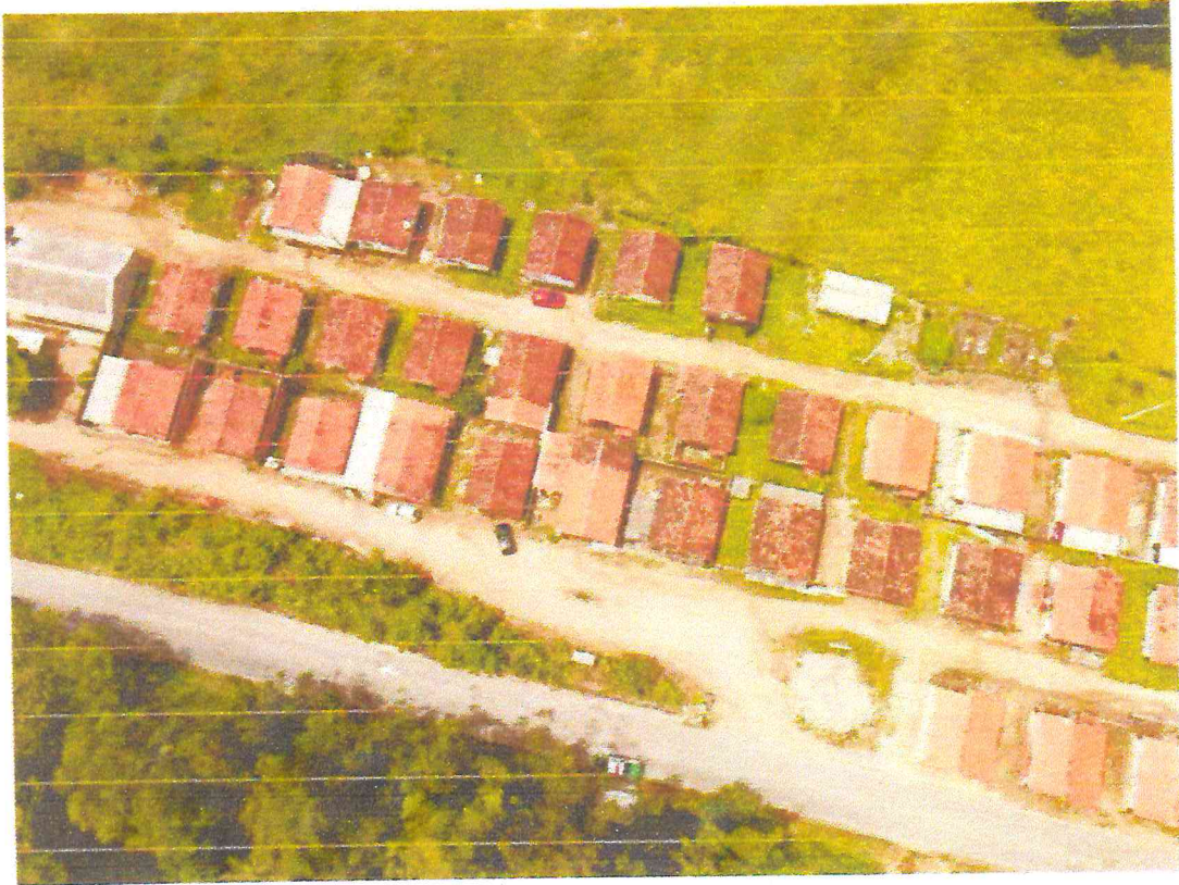
Tipo da imagem: Foto da Rua/Avenida Descrição da foto: Rua dos Lagos