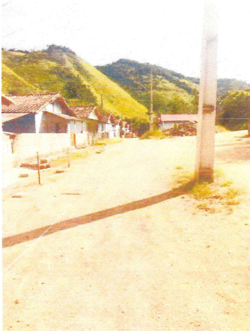
Tipo da imagem: Foto da Rua/Avenida Descrição da foto: Rua dos Lagos