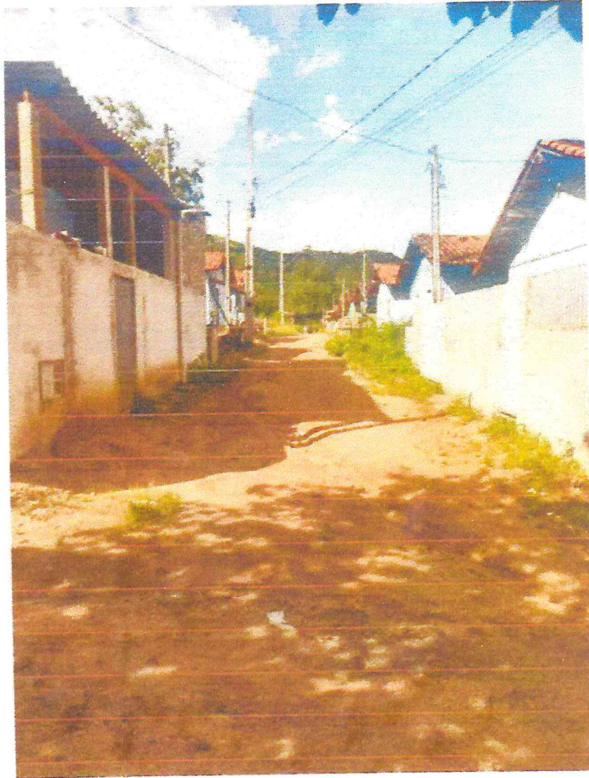
Tipo da imagem: Foto da Rua/Avenida Descrição da foto: Rua dos Lagos