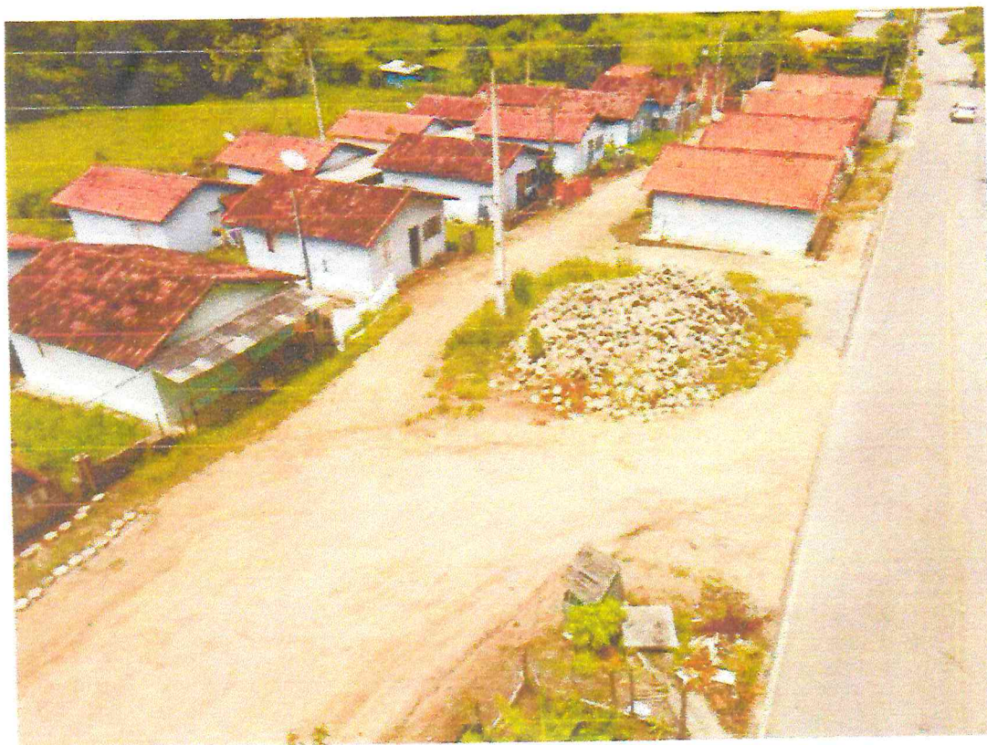
Tipo da imagem: Foto da Rua/Avenida Descrição da foto: Rua dos Lagos