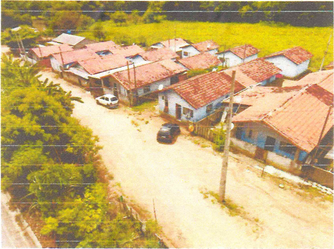
Tipo da imagem: Foto da Rua/Avenida Descrição da foto: Rua dos Lagos