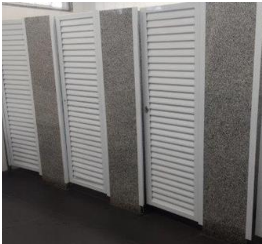
Foto 1: Foto Ilustrativa de como deverá ficar as portas das divisórias dos banheiros.