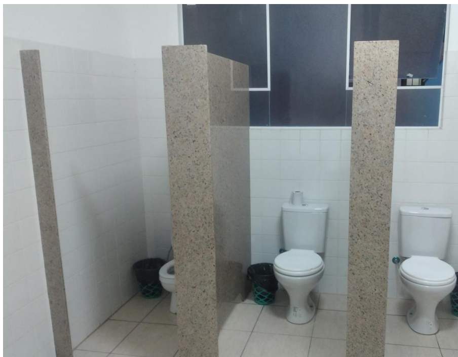
Foto 2: Foto das Divisórias Existentes que ainda não possuem portas